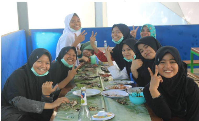
Gambar 57. Siswa pada momen tertentu diminta untuk menyiapkan/memasak makanannya sendiri.

“Jadikan hidup anda mandiri, karena kemerdekaan sejati hanya bisa anda rasakan melalui hidup mandiri”