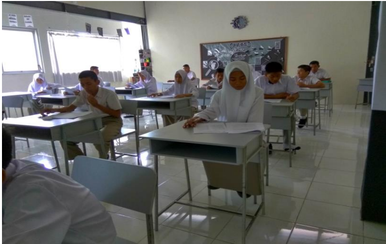
Gambar 38. Ujian tanpa pengawasan di Sekolah Islam Athirah Bone

Jujur atau kejujuran adalah suatu hal yang mengacu pada aspek karakter, moral, dan berbudi luhur seperti integritas, keterusterangan, termasuk pada perilaku yang beriringan dengan tidak adanya kebohongan, penipuan, dll. Jujur merupakan sifat yang sangat diperlukan dalam kehidupan sosial.