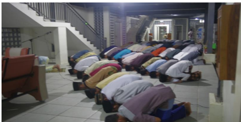
Gambar 29. Siswa putra melaksanakan salat tahajjud secara berjamaah di selasar asrama.

2011 di bawah naungan yayasan pendidikan Kalla. Salah satu ciri Islam yang menonjol adalah menjalankan sunnah Rasul. Bentuk penerapan sunnah Rasul diantaranya yaitu salat malam. SMP-SMA Islam Athirah Bone menggalakkan gerakan melaksanakan salat malam berjamaah atau kerennya disebut Gerakan Asmara di Asrama (Athirah Salat Malam Berjamaah). Salat malam dilaksanakan mulai dari setelah salat isya sampai sebelum salat subuh. Namun, waktu terbaik untuk melaksanakan salat malam yaitu pada sepertiga malam terakhir. Pada malam itu Allah turun ke bumi untuk melihat hambanya yang terbangun untuk salat dan berdzikir mengingat-Nya. Pada malam itu juga Allah akan mengabulkan semua doa hambanya yang sedang meminta kepadanya.