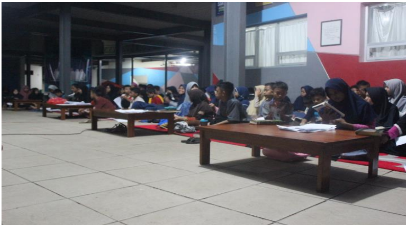
Gambar 37. MPK Menggelar Sidang Mukilas

Sidang Mukilas akan memutuskan apakah laporan pertanggung jawaban akhir OSIS akan diterima atau tidak. Ketika laporan pertanggung jawaban akhir OSIS tidak diterima maka pengurus OSIS pada periode tersebut akan cacat kepengurusan. Cacat kepengurusan adalah pengurus OSIS periode sebelumnya dilarang masuk ke dalam organisasi apapun pada periode berikutnya hingga selesai menempuh pendidikan di SMP Islam Athirah Bone.