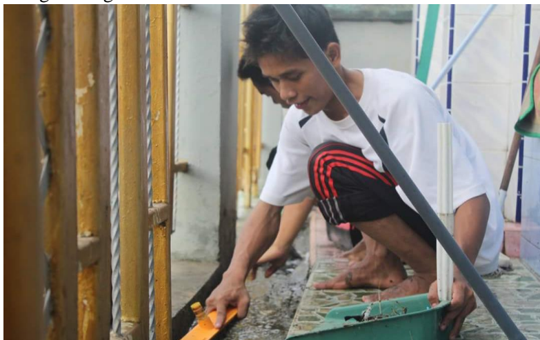
Gambar 35. Salah seorang siswa membersihkan asrama

merupakan budaya hidup bersih dan sehat yang dapat menciptakan suasana menjadi lebih produktif dan efektif. Konsep 5R di Athirah Bone dijadikan sebagai fundamental atau dasar untuk mengembangkan karakter siswa.