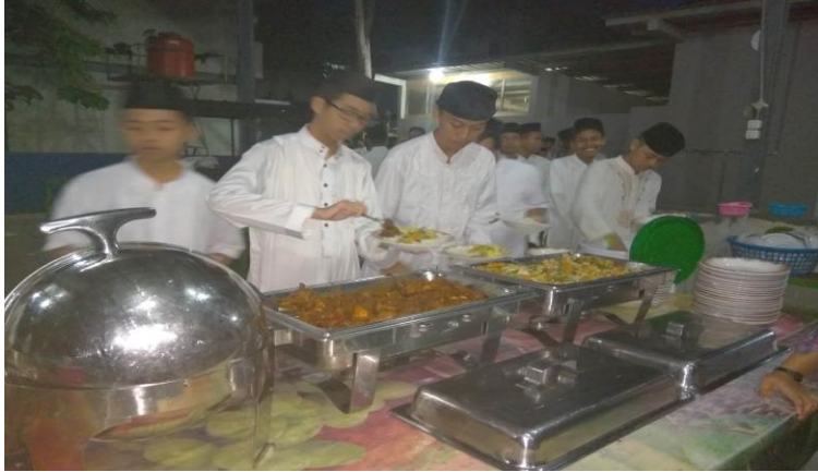
Gambar 39. Siswa tertib dan teratur saat antri di ruang makan.