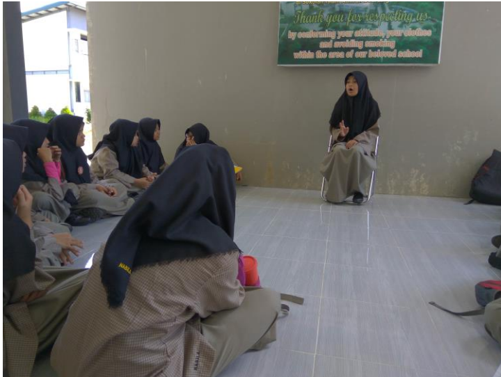
Gambar 10. Program Mentoring oleh kakak kelas dapat menangkal praktek-praktek bullying di Sekolah Islam Athirah Bone

Manusia sebagai makhluk sosial tidak pernah lepas dari interaksi sosial. Di lingkungan sekolah, saat bermain bersama teman-teman, bercanda, melakukan kegiatan bersama, dan tertawa bersama merupakan bentuk interaksi sosial. Bahkan pada saat meminjam pulpen pun, itu juga termasuk interaksi. Di sekolah, terjadi interaksi antara siswa dengan siswa lainnya dan juga antara siswa dengan pendidik. Namun tak jarang dalam sebuah interaksi antar siswa sering menimbulkan efek yang negatif. Tidak sedikit dari mereka melakukan hal-hal yang menyimpang dalam