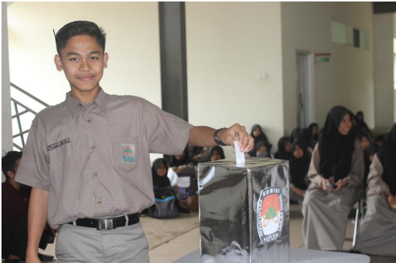
Gambar 25. Seorang siswa menggunakan ha suaranya pada Pemilos

kepanitiaan kecil yang disetujui oleh MPO yaitu KPPS (Kelompok Penyelenggaraan Pemungutan Suara). KPUS menimbang bahwa dalam usaha meningkatkan standar proses pemungutan suara pada pemilihan ketua dan wakil ketua OSIS Siswa di SMP Islam Athirah Bone, maka dipandang perlu mengangkat Kelompok Penyelenggaraan Pemungutan Suara (KPPS). Mengingat adanya peraturan menteri pendidikan Nasional Indonesia No. 34 Tahun 2006 tentang pembinaan prestasi siswa yang memiliki potensi kecerdasan dan atau bakat istimewa.