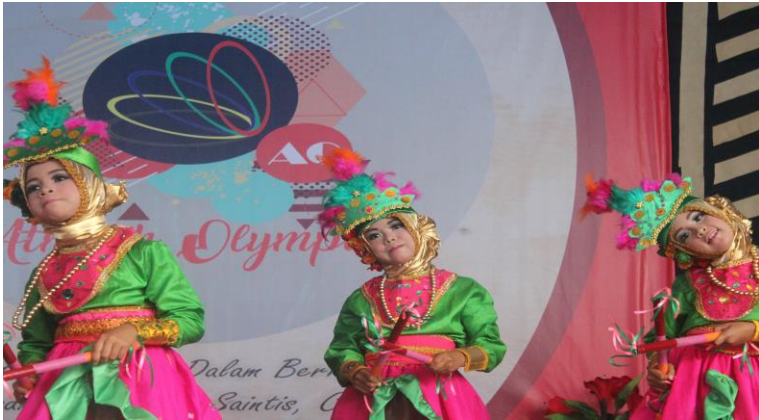
Gambar 22. Salah satu peserta menampilkan kemampuannya dalam lomba menari di Athirah Olympic

SMP-SMA Islam Athirah Boarding School Bone merupakan sekolah yang terkenal dengan bakat dan prestasi yang dimiliki oleh siswa siswinya. Banyaknya bakat ini, menjadi landasan diadakannya berbagai program-program pengembangan diri siswa untuk lebih mengembangkan bakat yang mereka miliki. Bukan hanya mengadakan ajang pengembangan untuk siswanya saja. Sekolah ini juga membuat ajang yang bisa diikuti oleh siswa dari luar SMP-SMA Islam Athirah Boarding School Bone. Salah satunya ialah Athirah Olympic.