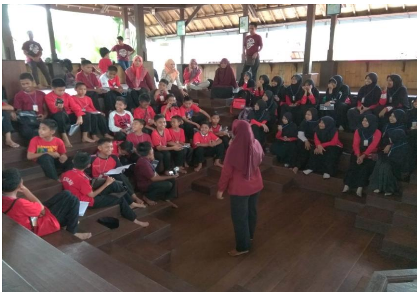
Gambar 50. Siswa menerima pengarahan saat tiba di lokasi fieldtrip .

Menurut (Roestiyah, 2001:85), field trip ialah cara mengajar yang dilaksanakan dengan mengajak siswa ke suatu tempat atau obyek tertentu di luar sekolah untuk mempelajari atau menyelidiki sesuatu seperti meninjau pabrik sepatu, suatu bengkel mobil, toko serba ada, peternakan, perkebunan, lapangan bermain dan sebagainya. Tujuan dari diadakannya field trip yaitu agar peserta field trip bisa mendapatkan metode belajar yang menyenangkan karena mereka bisa belajar sambil melakukan kegiatan wisata kebeberapa tempat.