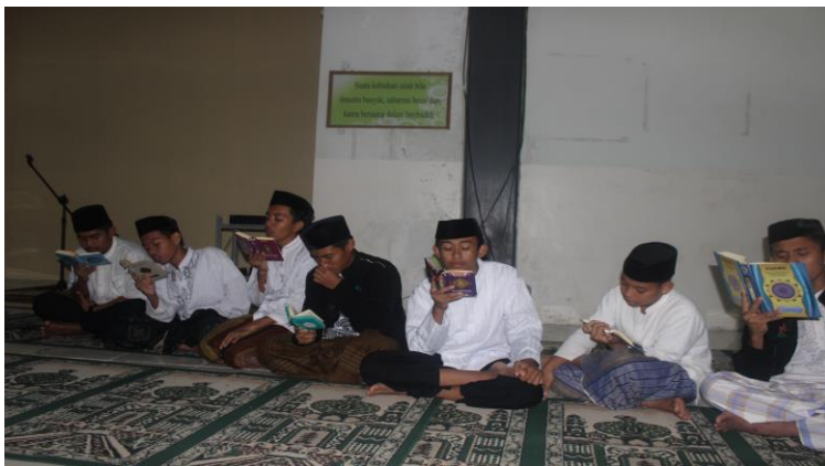
Gambar 40. Siswa-siswa sedang berada di kelas tahfidz

Bisa berinteraksi dengan Alquran secara baik, intensif, dan kontinyu merupakan karunia dari Allah dan suatu kebanggaan tersendiri bagi seorang muslim dapat menjadi penghawal Alquran dalam hidup ini. Dengan interaksi tersebut diharapkan kita, Insha Allah akan memperoleh keberkahan, kebaikan, sekaligus kebahagiaan. Hal ini seperti yang disabdakan Rasulullah SAW dalam sebuah hadist: