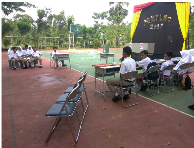
Gambar 24. Proses pemungutan suara dalam Pemilos

Pemilihan Umum Sekolah). Panitia ini dibentuk melalui tes wawancara langsung dari MPO (Majelis Pembina OSIS). KPUS merupakan panitia yang mengatur segala proses dalam pemilihan ketua dan wakil ketua OSIS, mulai dari pendaftaran hingga pelantikan ketua dan wakil ketua OSIS terpilih.