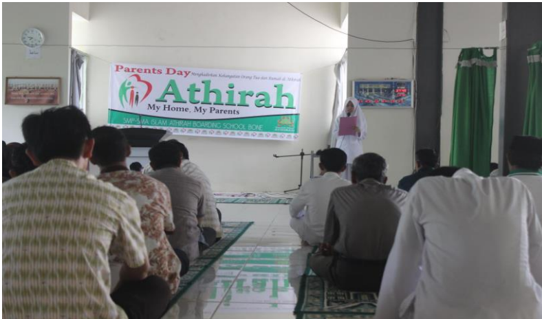
Gambar 9. Suasana pembukaan kegiatan Parents Day

menjadi guru dan melihat langsung kegiatan yang dialami oleh siswa di sekolah.