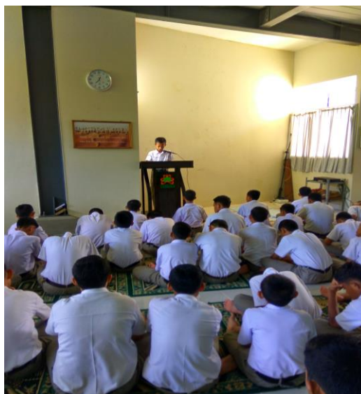
Gambar 42. Siswa membacakan Quotes of the Day setelah pembacaan hadits sesaat setelah salat duhur berjamaah.

Motivasi Adalah suatu dorongan kehendak yang menyebabkan seseorang melakukan suatu perbuatan untuk mencapai suatu tujuan tertentu. Menurut Hariyanto (2013), misalnya ingin menghafal satu halaman Alquran perhari. Jika tidak memiliki motivasi dalam menghafal maka besar kemungkinan seseorang tersebut untuk gagal dalam mencapai targetnya dikarenakan dalam menghafal godaan yang akan dialami oleh seseorang pastilah sangat banyak. Contoh lain ialah saat