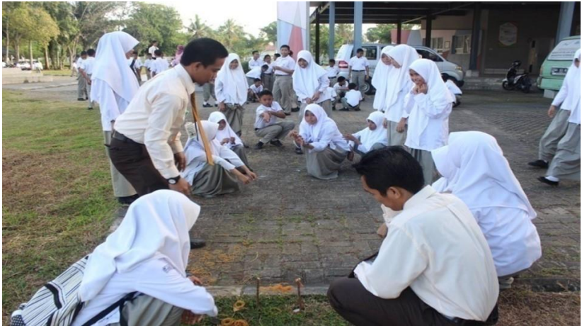
Gambar 18. Guru dan siswa larut dalam asyiknya permainan lempar karet

Permainan Tradisional merupakan permainan sederhana yang dimainkan oleh anak-anak pada zaman dahulu. Menurut Danandjaja (1984), permainan tradisonal merupakan bentuk folklor dimana peredarannya dilakukan secara lisan, berbentuk tradisional, dan diwariskan secara turun-temurun. Oleh sebab itu, terkadang asal-usul dari permainan tradisional tidak diketahui secara pasti siapa penciptanya dan darimana asalnya, karena penyebarannya yang berupa lisan. Terkadang, permainan tradisional ini mengalami perubahan nama atau bentuk walaupun dasarnya sama. Berdasarkan sifat permainan, permainan rakyat dapat dibagi menjadi dua golongan besar, yaitu permainan untuk bermain dan permainan