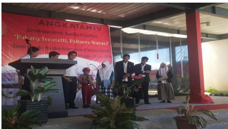
Gambar 1. Testimoni siswa baru di panggung Welcoming Day bersama para pimpinan sekolah

Hari pertama bersekolah adalah yang paling berkesan bagi siswa dan orang tua siswa. Apalagi hari pertama bersekolah di boarding school atau sekolah berasrama, tentunya lebih berkesan lagi. SMP-SMA Islam Athirah Boarding School Bone menyambut kedatangan siswa baru dengan melaksanakan kegiatan Welcoming day . Kegiatan ini dilakukan setelah seluruh rangkaian tes penerimaan siswa baru berakhir, diantaranya tes tertulis, tes wawancara, survey rumah, serta tahap Academic Camp . Acara ini menjadi momen yang sangat mengharukan antara siswa dan orang tua yang sudah akan melepas anak-anak mereka untuk menjalani kehidupan di asrama, hal ini sekaligus menjadi latihan mental untuk orang tua agar ikhlas melepas anaknya.