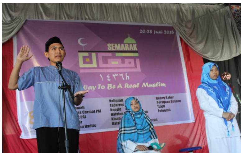
Gambar 43. Cabang lomba Sari Tilawah pada ajang Semarak Ramadhan.

Semarak Ramadhan merupakan program unggulan Sekolah Islam Athirah Boarding School Bone di bulan ramadhan. Program ini salah satu program tahunan SMP-SMA Islam Athirah Bone. Sejak berdirinya sekolah ini, program semarak ramadhan selalu dilaksanakan. Tahun demi tahun program ini semakin berkembang dan semakin mengalami banyak perubahan mulai dari lomba-lomba yang ada sampai dengan peraturan-perturan ataupun persyaratan untuk mengikuti kegiatan ini. Namun hal itu membuat suasana yang baru dan menarik.