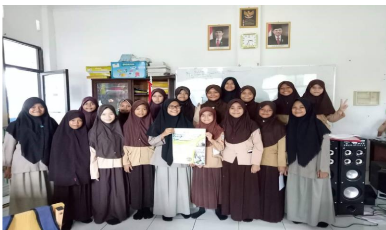
Gambar 54. Sosialisasi siswa SMA Athirah Bone ke sekolah asal.

Panitia dalam PSB SMP-SMA Islam Athirah Bone tidak hanya dari guru melainkan juga dari siswa. Berhubung siswa SMP-SMA Islam Athirah Bone berasal dari berbagai daerah, maka siswa akan mensoaliasasikan kepada calon siswa baru mengenai PSB SMP-SMA Islam Athirah Bone.