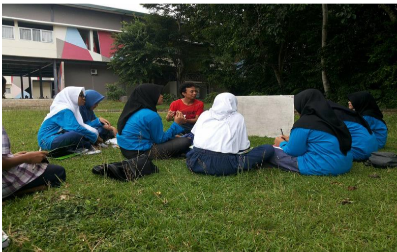
Gambar 12. Kegiatan English Club di SMP-SMA Islam Athirah Bone.

English area merupakan program unggulan Organisasi Siswa Intra Sekolah (OSIS) SMP Islam Athirah Boarding School Bone. Adapun area berarti daerah atau bagian pada permukaan bumi. Tetapi, english area di SMP Islam Athirah Boarding School Bone berarti tempat atau daerah wajib berbahasa Inggris. Program ini mewajibkan seluruh siswa SMP Islam Athirah Boarding School Bone untuk berbahasa Inggris saat berada pada english area . Kegiatan ini terbentuk berdasarkan pada adanya english village di Pare, Kediri. Pada awalnya english area digagas dengan nama english day . Namun, program ini kemudian diamanahkan kepada