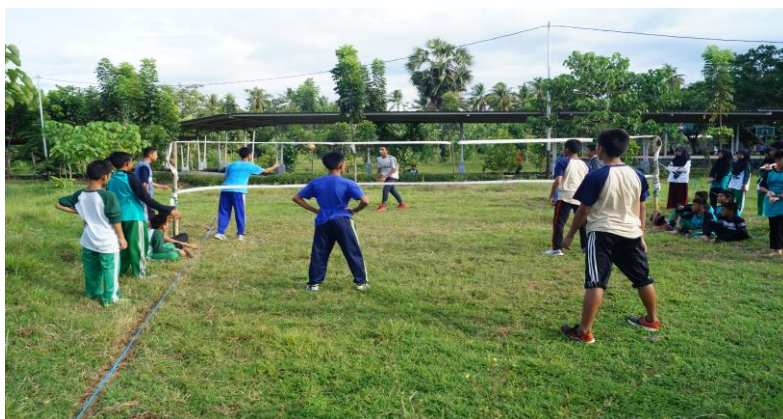
Gambar 21. Kegiatan Porseni di Athirah Bone

Ketika porseni, guru-guru di Athirah Bone, khususnya guru olahraga dan seni budaya mengamati dengan jeli para siswa yang memiliki bakat istimewa dibidang olahraga maupun seni. siswa yang dipilih oleh guru tersebut akan dilatih dan dikarantinakan untuk mempersiapkannya dalam rangka mengikuti perlomba pada ajang O2SN dan FLS2N yang dilaksanakan setiap tahunnya oleh pemerintah. Selain itu, sebagai ajang memperkokoh persaudaraan dan rasa saling memiliki diantara siswa. Hal tersebut dibuktikan dengan saling menghargai dan saling membantu sesama walaupun siswa tersebut berkompetisi dalam perlombaan yang sama.