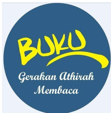
Gambar 51. Gerakan Donasi Buku adalah pelopor gerakan literasi membaca di Sekolah Islam Athirah Bone

Membaca bagi sebagian masyarakat sudah menjadi budaya. Bahkan sebagian kecil masyarakat beranggapan bahwa membaca merupakan suatu kebutuhan. Jenis bacaannya juga beragam mulai dari buku pelajaran sampai buku fiksi seperti buku novel dan buku dongeng. Untuk zaman digital sekarang ini masyarakat sudah sangat dimudahkan dengan kecanggihan teknologi, contohnya saja membaca. Kegiatan ini sudah dapat dilaksanakan dengan e-book yang disediakan oleh smarphone dengan cara mengunduh baik yang gratis maupun berbayar.