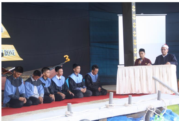
Gambar 26. Sidang Tahfidz yang digelar di hadapan siswa, guru, dan orang tua pada acara penamatan.

Salah satu sekolah di Indonesia yang menggunakan sistem boarding school atau sekolah berasrama adalah Sekolah Islam Athirah Boarding School Bone yang merupakan sekolah swasta di bawah naungan Yayasan Kalla yang terletak di daerah Kabupaten Bone, Sulawesi Selatan. Di dalam Boarding school tidak lepas dari yang namanya kebersamaan. Seperti halnya Sekolah Islam Athirah Boarding School Bone yang hampir semua kegiatan dilakukan secara bersama-sama. Misalnya saja membersihkan lingkungan sekolah maupun beberapa area tertentu di asrama, belajar mengenai pelajaran-pelajaran di sekolah, shalat berjamaah, dan