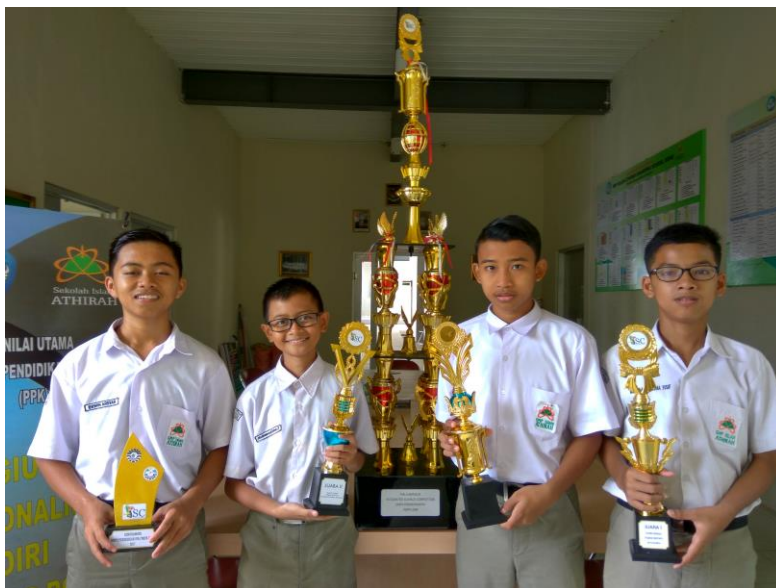
Gambar 41. Anggota Ekskul Biologi berfoto dengan piala yang diraihnya.

Ekstrakurikuler adalah kegiatan non-pelajaran formal yang dilakukan peserta didik sekolah atau universitas, umumnya di luar jam belajar kurikulum standar. Kegiatan ekstrakurikuler ditujukan agar siswa dapat mengembangkan kepribadian, bakat, dan kemampuannya di berbagai bidang di luar bidang akademik maupun dalam bidang akademik. SMP Islam Athirah Bone juga mempunyai kegiatan ekstrakurikuler, baik dibidang akademik maupun non-akademik.