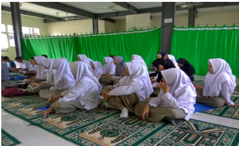
Gambar 5. Siswa mengikuti materi keagamaan dalam LDKS

Adapun tata tertib di SMP Islam Athirah dibagi menjadi dua bagian yaitu peraturan umum dan peraturan tambahan. Peraturan umum adalah peraturan yang mengatur jalannya LDKS yang dibuat oleh panitia dan disepakati oleh seluruh peserta. Sedangkan peraturan tambahan adalah peraturan yang ditambah atau yang disarankan oleh peserta dan disepakati oleh seluruh peserta LDKS.