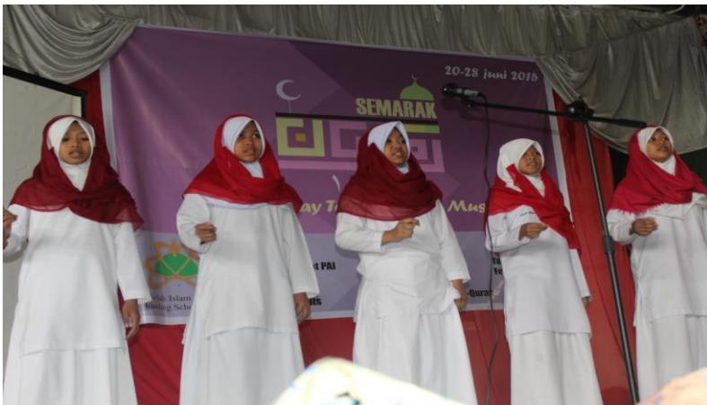
Gambar 44. Lomba nasyid di Semarak Ramadhan

Takjil artinya kudapan saat berbuka berpuasa. Pada lomba takjil, peserta membuat hidangan makanan untuk berbuka puasa. Tujuan diselenggarakannya lomba ini yaitu melatih kekreativitasan siswa, menambah wawasan siswa dalam memasak.