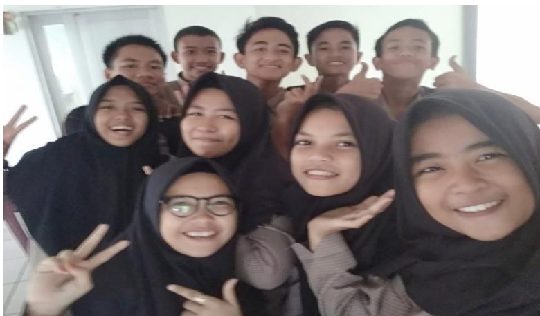
Gambar 58. Senyum manis siswa-siswi SMP Islam Athirah Bone

Karakter merupakan aspek penting dalam membentuk peserta didik unggul karena karakter merupakan sebuah pokok yang mencakup sikap, sifat, perilaku, dan juga pola pikir. Dari empat poin tersebut, bisa diketahui bahwa karakter juga memengaruhi kegiatan seseorang atau apa yang ingin dilakukan oleh orang tersebut. Karakter juga harus diolah dengan baik demi membentuk karakter yang berkualitas. Karakter yang berkualitas perlu dibimbing dan dibina sejak dini dan berkelanjutan karena karakter yang berkualitas akan membentuk pribadi yang berkualitas pula. Sebaliknya, bila kegagalan penanaman karakter unggul telah ada dalam diri peserta didik, kelak ia akan menjadi sosok yang gagal. Banyak upaya yang dapat dilakukan dalam