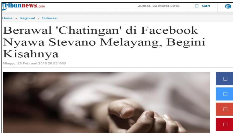
Gambar 15. Penggunaan media sosial yang tidak terkontrol pada anak dapat membahayakan jiwanya.

Penggunaan sosmed di SMP Islam Athirah Boarding School Bone dimulai pada hari sabtu atau ahad. Bagi siswi pada hari sabtu dan siswa pada hari ahad. Nah, perbedaan jadwal yang diterapkan ini bertujuan untuk mencegah adanya komukasi terselubung antara perempuan dan laki laki melalui facebook, twitter, instagram dan lain sebagainya dan juga mencegah adanya pacaran akibat terlalu seringnya chatingan antara lawan jenis.