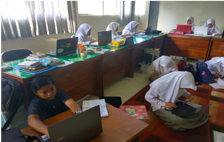
Gambar 14. Siswa SMP Islam Athirah Bone dilatih dan diarahkan untuk mahir memanfaatkan media sosial untuk kegiatan yang bermanfaat,

Media sosial adalah sebuah layanan jejaring sosial di internet, dengannya para pengguna bisa dengan mudah berpartisipasi, berbagi, dan menciptakan isi meliputi blog, jejaring sosial, wiki, forum dan dunia virtual. Blog, jejaring sosial dan wiki merupakan bentuk media sosial yang paling umum digunakan oleh masyarakat di seluruh dunia. Pendapat lain mengatakan bahwa media sosial adalah media online yang mendukung interaksi sosial dan media sosial menggunakan teknologi berbasis web yang mengubah komunikasi menjadi dialog interaktif.