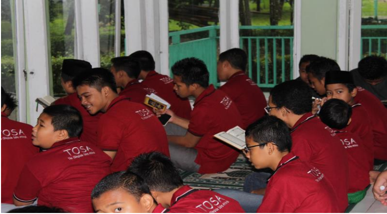
Gambar 46. Kegiatan tadarrus bersama di sela-sela pembimbingan

Pesantren OSN dilaksanakan di LEC Sekolah Islam Athirah Bukit Baruga. Yakni di Jln. Raya Baruga, Antang, Makassar. Pesantren OSN dilaksanakan oleh Tim Olimpiade Sains Athirah (TOSA). Tim ini berasal dari guru guru Sekolah Islam Athirah. Peserta tidak memiliki kebebasan dalam mengikuti kegiatan Pesantren OSN. Tentunya peserta memiliki hak, kewajiban, dan larangan. Berikut hak, kewajiban, dan larangan peserta Pesantren OSN: