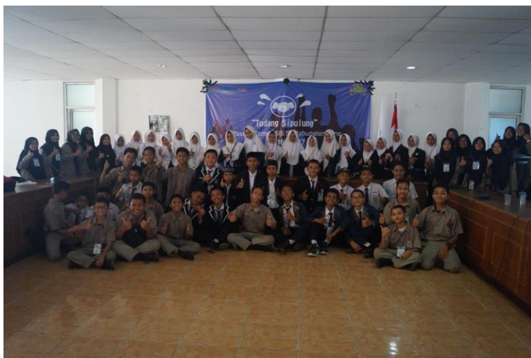
Gambar 47. Peserta Temu OSIS SMP Se-Kab.Bone 2017

OSIS adalah organisasi intra sekolah yang berfungsi mewadahi dan menghimpun potensi para peserta didik. OSIS mempersiapkan siswa sebagai kader penerus perjuangan bangsa dan pembangunan nasional dengan memberikan bekal keterampilan, kepemimpinan, tanggung jawab, mandiri, wawasan luas, kesegaran jasmani, daya kreasi, patriotisme, kepribadian dan budi pekerti luhur.