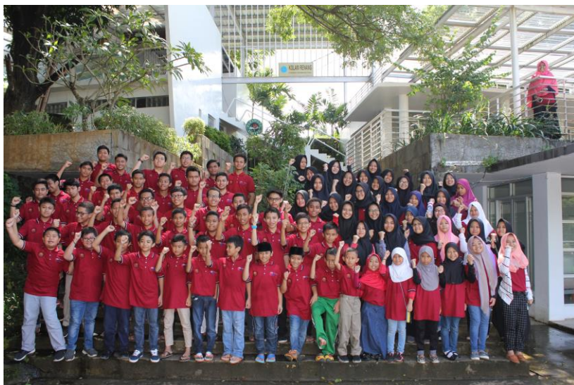
Gambar 45. Peserta Pesantren OSN Sekolah Islam Athirah

Seiring berkembangnya pendidikan yang berintegrasi pada pencapaian prestasi peserta didik, lahirlah berbagai jenis lomba yang diadakan oleh lembaga formal maupun non formal. Salah satu dari lomba tersebut adalah Olimpiade Sains Nasional. Olimpiade Sains Nasional adalah ajang berkompetisi dalam bidang sains pada jenjang SD, SMP, dan SMA di Indonesia. Siswa yang mengikuti Olimpiade Sains Nasional adalah siswa yang telah lolos seleksi tingkat kabupaten dan provinsi. Mereka adalah siswa-siswi yang terbaik dari provinsi masing masing.