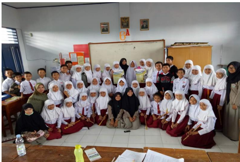
Gambar 53. Sosialisasi siswa pada penerimaan siswa baru

PSB adalah kegiatan penerimaan dan seleksi calon peserta pendidikan dan pelatihan pada sekolah, hal tersebut berkaitan dengan kemampuan dasar akademik dan minat bakat terhadap jenjang sekolah yang dituju sebagai bentuk awal pengendalian penjaminan dan penetapan mutu pendidikan. Guna mendukung upaya jenjang pendidikan ke arah tujuan yang diinginkan.