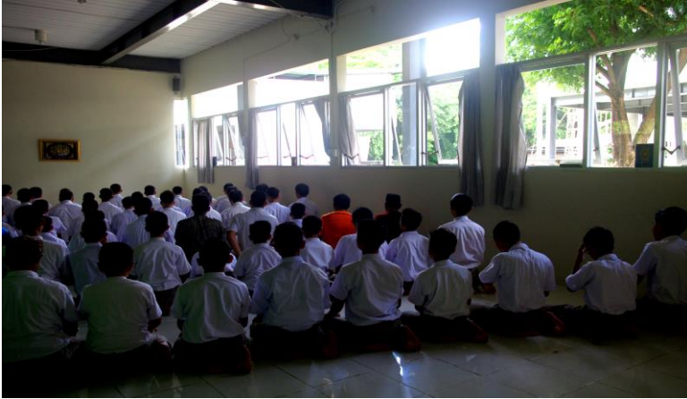
Gambar 27. Salat Berjamaah adalah kultur yang sudah mengakar dalam diri setiap warga yang ada di Sekolah Islam Athirah Bone