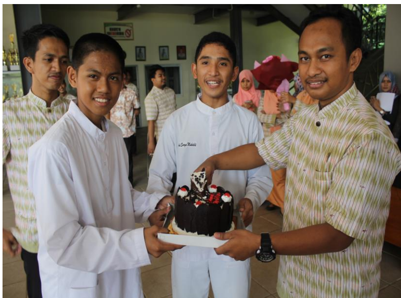
Gambar 33. Salah satu ungkapan cinta para siswa pada gurunya.

Dalam upaya mendisiplinkan siswanya sekolah Islam Ahirah Boarding School Bone mengulirkan sebuah program rutin yakni program morning greeting . Secara bahasa Morning greeting berarti ucapan selamat pagi. Tentunya, ucapan selamat pagi ini berbeda dengan ucapan selamat pagi yang romantis, karena ucapan selamat pagi ini berlaku bagi seluruh warga SMP-SMA Islam Athirah Bone yang sedang membutuhkan ucapan selamat pagi.