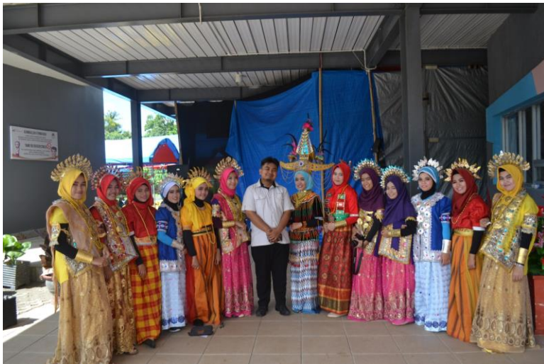
Gambar 7. Keberagaman di SMP-SMA Islam Athirah Bone

kecerdasan emosional, intelektual, dan spiritual. Kurikulum yang digunakan adalah kurikulum Nasional, namun tetap pada ciri khas Athirah. Program-program yang dibuat memproses Sekolah Islam Athirah Bone menjadi sekolah efektif dan sentral pembelajaran. Prestasi-prestasi yang dibangun tidak hanya pada wilayah intrakurikuler, tetapi juga pada wilayah ekstrakurikuler. Baik pada tingkat regional, nasional, maupun internasional. Metode pembelajaran yang dikembangkan adaptif terhadap teknologi dan metode pembelajaran kekinian yang memerdekakan siswa dengan pendekatan active learning .