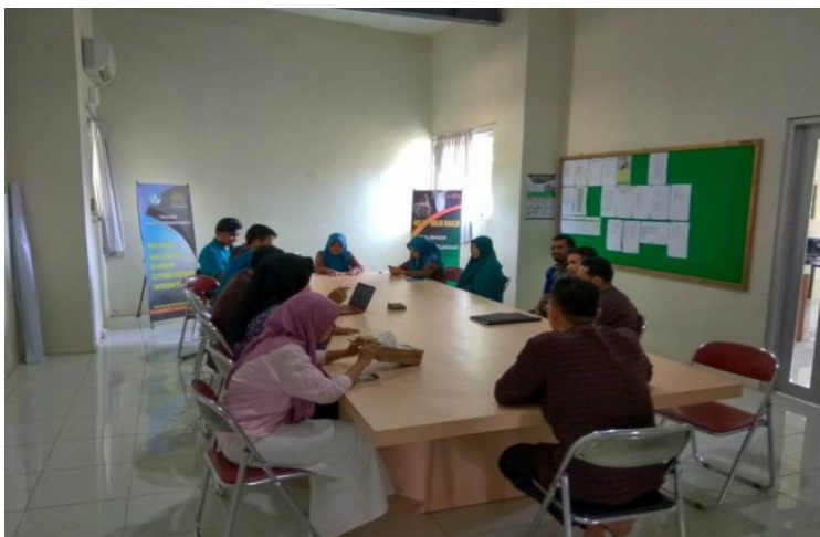
Gambar 59. Briefing pagi di SMP Islam Athirah Bone

Mungkin Morning Briefing masih jarang, bahkan belum diterapkan pada beberapa sekolah diluar sana. Mengapa? Karena mereka belum mengetahui apa yang sebenarnya dilakukan pada saat Morning Briefing . Mereka baru ingin menyelesaikan persoalan mereka saat sudah terlalu parah, sehingga kegiatan mereka tidak efektif. Maka dari itu kita harus tahu apa pengertian Morning Briefing yang sebenarnya.