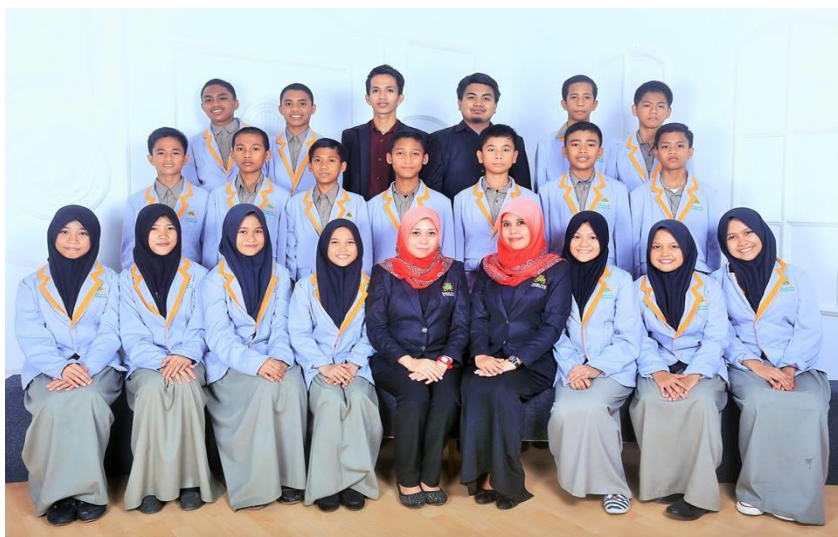
Gambar 54. Pengurus OSIS SMP Islam Athirah berfoto bersama Pembina OSIS.

Organisasi atau dalam bahasa Yunani biasa disebut “organon” adalah suatu kelompok orang dalam suatu wadah untuk tujuan bersama. Pada dasarnya, organisasi digunakan sebagai tempat atau wadah bagi orang-orang untuk berkumpul, bekerja sama secara rasional dan sistematis, terencana, terpimpin dan terkendali, dalam memanfaatkan sumber daya (uang, material, mesin, metode, lingkungan, sarana-parasarana, data, dan lain sebagainya) yang digunakan secara efisien dan efektif untuk mencapai tujuan organisasi. Menurut Victor A Thompson, seorang pakar politik Australia mengatakan bahwa organisasi adalah suatu