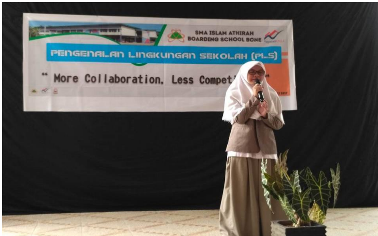
Gambar 2. Seorang siswi memandu pembukaan PLS SMA Islam Athirah Boarding School Bone

Memulai jenjang pendidikan formal yang baru bagi peserta didik baru disekolah baru pula merupakan sebuah masa ketika ia harus berhadapan dengan lingkungan dan dunia yang baru. Oleh kerana itu, siswa memerlukan tahap peninjauan, pengenalan, dan adaptasi terhadap lingkungan baru yang mereka datangi sekaligus mereka tempati. Tahap itulah yang akan mereka lalui dalam kegiatan Masa Orientasi Siswa (MOS) yang sekarang dikenal dengan Pengenalan Lingkungan Sekolah (PLS).