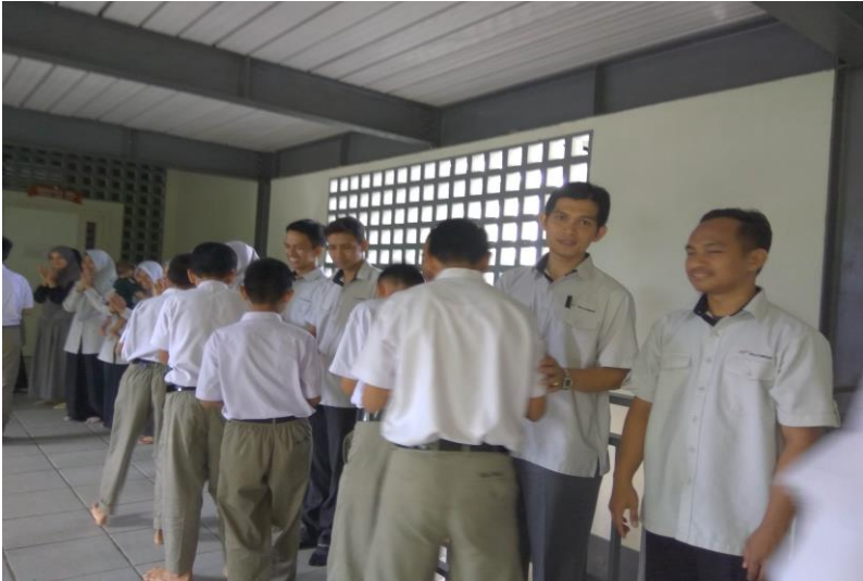
Gambar 32. Salam dan sapa guru pada siswa saat akan pergi ke sekolah.

Kedisiplinan adalah suatu kondisi yang tercipta dan terbentuk dari serangkaian perilaku yang menunjukkan nilai-nilai ketaatan, kepatuhan, kesetiaan, keteraturan dan ketertiban. Kedisiplinan dalam proses pendidikan sangat diperlukan karena bukan hanya untuk menjaga kondisi suasana belajar dan mengajar berjalan dengan lancar, tetapi juga untuk menciptakan pribadi yang kuat bagi setiap siswa.