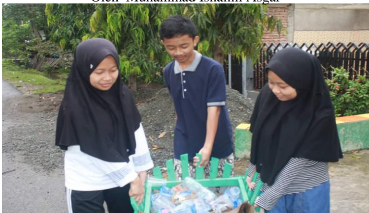
Gambar 34. Siswa dan siswi Sekolah Islam Athirah Bone bergotong royong membersihkan lingkungan sekitar.