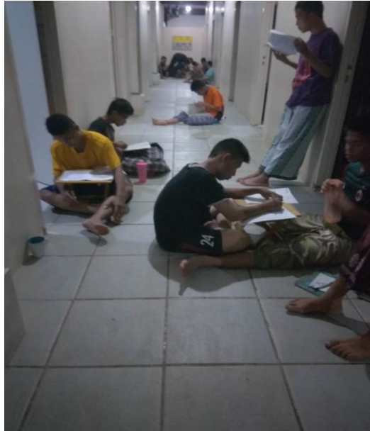
Gambar 11. Meski dari strata ekonomi yang jauh berbeda, siswa-siswi Sekolah Islam Athirah Bone menjadikan sekolah dan asrama sebagai alasan untuk memperlambat tali persaudaraan.

Tidak hanya bully dan senioritas. Berbagai bentuk vandalisme dapat dengan mudah kita temukan di lingkungan sekitar. Bahkan di media massa pun kita dapat menemukan berita-berita tentang aksi perusakan yang dilakukan oleh sejumlah orang pada saat terjadi demonstrasi, mobilisasi massa, ataupun kerusuhan. Seseorang melakukan vandalisme pun, atas dasar berbagai alasan. Ada yang melakukan vandalisme atas dasar kebebasan mengekspresikan ide-ide seni yang mereka miliki. Tidak sedikit juga dari mereka melakukan vandalisme hanya untuk mendiskreditkan orang lain. Namun pada umumnya, seorang