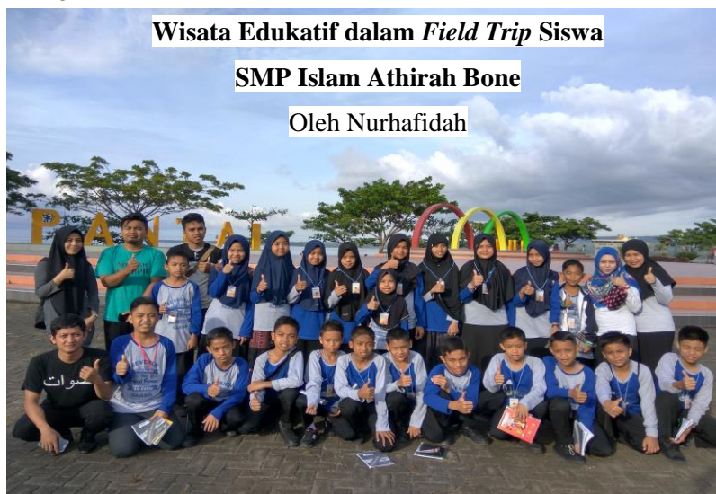
Gambar 49. Kegiatan Field Trip SMP Islam Athirah Bone di Kota Bantaeng, Sulawesi Selatan

Terkadang ada siswa yang tidak fokus ketika guru menjelaskan saat proses pembelajaran di kelas, selalu bermain-main, atau bahkan ada yang tertidur, dan sebagainya. Hal tersebut bisa membuat proses pembelajaran di kelas menjadi tidak efektif dan tujuan dari proses pembelajaran tersebut pun tidak dapat tercapai. Untuk mengatasi masalah tersebut dapat dilakukan dengan mengubah metode pembelajaran menjadi lebih menarik. Ada banyak metode yang bisa diterapkan dalam proses pembelajaran agar proses pembelajaran tersebut bisa berjalan efektif sehingga siswa bisa dengan mudah memahami materi yang dipelajari. Salah satunya yaitu dengan metode pembelajaran yang bentuk pelaksanaannya melalui kegiatan field trip .