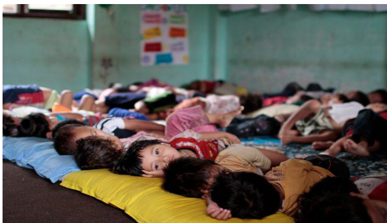
Gambar 55. Ilustrasi anak-anak sedang tidur siang.

Tidur merupakan salah satu kebutuhan yang penting dan harus kita penuhi. Kondisi tubuh yang lelah setelah seharian beraktivitas adalah tanda kalau tubuh kita telah menguras banyak tenaga dan membutuhkan istirahat yaitu tidur. Dengan tidur, tubuh kita akan beristirahat. Karena, tidur merupakan waktu peristirahatan tubuh kita setelah beraktivitas dalam satu hari penuh. Apabila dalam satu hari kita kekurangan waktu tidur, itu akan sangat berdampak buruk pada aktivitas kita pada hari itu. Seperti belajar jadi tidak efektif, mengantuk saat belajar, ataupun susah dalam menangkap materi pembelajaran.