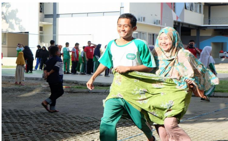
Gambar 8. Seorang siswa dan orang tuanya terlibat dalam keseruan bermain di Parents Day Sekolah Islam Athirah Bone

Salah satu bentuk upaya Sekolah Islam Athirah Bone untuk menjalin hubungan yang harmonis antara siswa dengan orang tua yaitu dengan melaksanakan Parents Day . Parents Day adalah hari yang disiapkan oleh SMP Islam Athirah Bone untuk mewujudkan kebersamaan orang tua dan anaknya selama sehari penuh di sekolah.