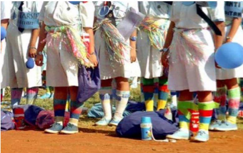
Gambar 3. Perploncoan adalah sesuatu yang tabu di SMP-SMA Islam Athirah Bone.

tersebut bisa masuk dan memulai pendidikannya di sekolah dengan riang gembira, optimis terhadap segala sesuatu yang hendak dilaksanakan, mau menjalankan proses belajar yang baik dan menerima kebijakan sekolah, maka sangat penting rasanya sebuah sekolah melaksanakan yang namanya PLS.