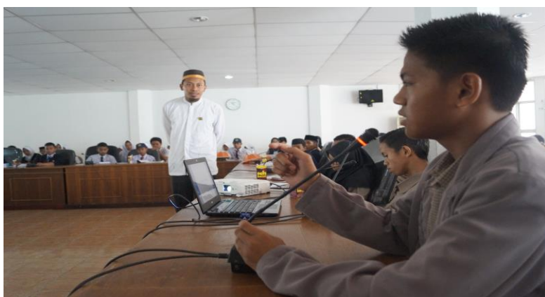
Gambar 48. Kelas Motivasi bersama Kepala SMA Islam Athirah Bone

peserta Temu OSIS dari masing masing sekolah menampilkan berbagai macam bakat yang berbeda. Ada yang menampilkan visualisasi puisi, pidato, drama pendek, stand up comedy , baca puisi, nyanyi solo dan banyak penampilan seru lainnya. Seluruh penampilan yang telah dipentaskan oleh peserta Temu OSIS diharapkan bisa menjadi inovasi baru bagi seluruh siswa, baik itu SMP Islam Athirah Bone selaku tuan rumah maupun sekolah peserta nantinya.