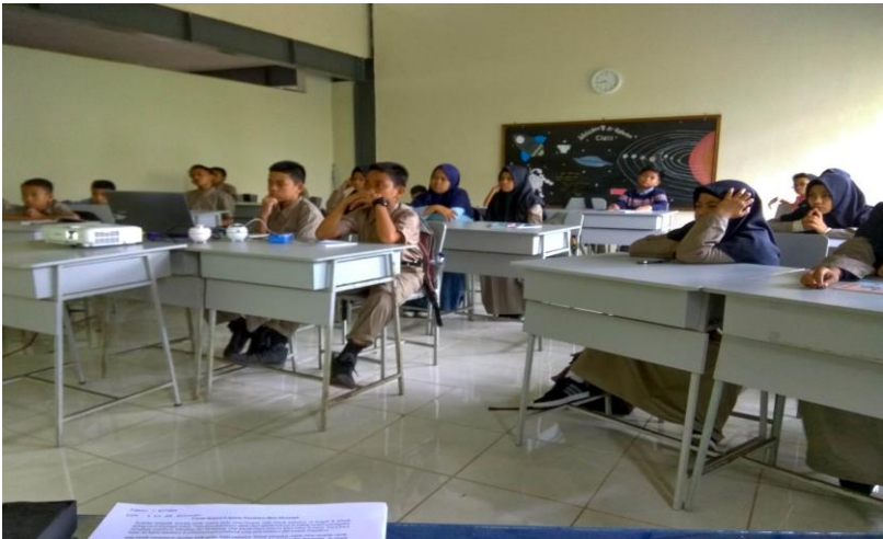
Gambar 4. Siswa fokus dan penuh perhatian dalam mengikuti kegiatan di LDKS

Latihan Dasar Kepemimpinan Siswa atau biasa disingkat dengan LDKS adalah sebuah program tahunan OSIS yang bertujuan untuk memberi bekal kepada siswa baru agar dapat menjadi organisator yang hebat. LDKS merupakan pelatihan yang diberikan di suatu organisasi untuk melatih para anggota baru tentang makna sebuah kerjasama dan kepemimpinan. LDKS biasanya dilaksanakan selama dua atau tiga hari yang ditangani oleh guru maupun pengurus OSIS.