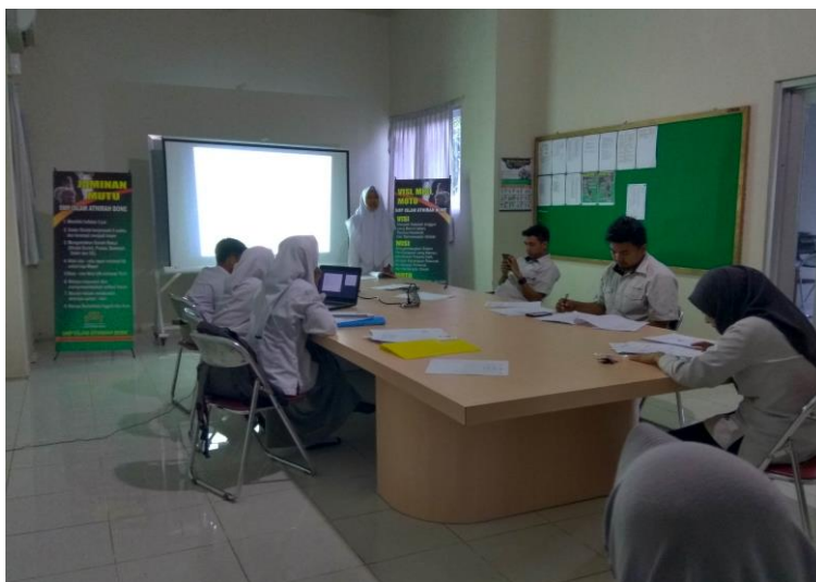
Gambar 17. Sidang Artikel Ilmiah siswa

hanya dihadiri oleh guru yang terkait dalam sidang. Guru yang hadir dalam sidang artikel telah ditentukan sebelumnya. Sidang secara terbuka dilakukan di tempat yang terbuka, karena sidang terbuka ini dihadiri oleh seluruh siswa dan juga guru yang menguji artikel siswa.