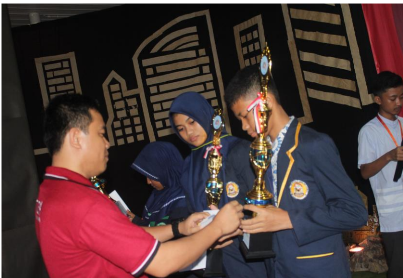
Gambar 23. Prosesi penyerahan piala kepada pemenang lomba akademik.

Setelah para peserta melewati seluruh rangkaian acara, maka akan diadakan acara penutupan sekaligus pengumuman juara dari setiap cabang lomba. Serta penentuan juara umum. Setiap cabang lomba akademik terdiri dari tiga orang pemenang, begitupun dengan cabang lomba di bidang olahraga. Kemudian, di bidang seni terdiri dari lima orang pemenang, dan dua diantaranya adalah juara harapan. Setelah keseluruhan juara diumumkan, tibalah saatnya untuk penentuan juara umum.