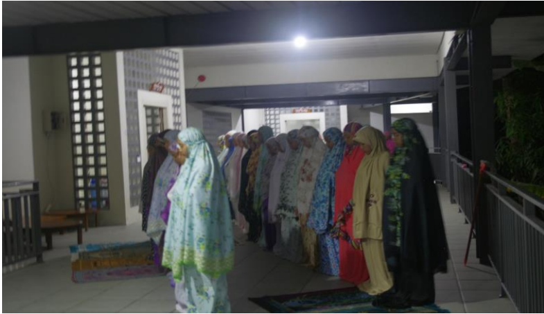
Gambar 28. Siswi Sekolah Islam Athirah Bone melaksanakan salat tahajjud secara berjamaah di selasar asrama

Rasulullah Muhammad Saw meninggalkan dua warisan yang harus dipegang teguh umatnya jika ingin selamat, beruntung, serta bahagia dunia dan akhirat. Dua warisan tersebut adalah Al Quran Al Karim serta Al Hadis. Al Quran merupakan wahyu yang terdiri atas 114 Surat dan 6666 ayat yang saling terkait satu sama lain sedangkan Al Hadis adalah ucapan Rasulullah yang disampaikan oleh sahabat-sahabatnya yang merupakan implementasi dari Al Quran.