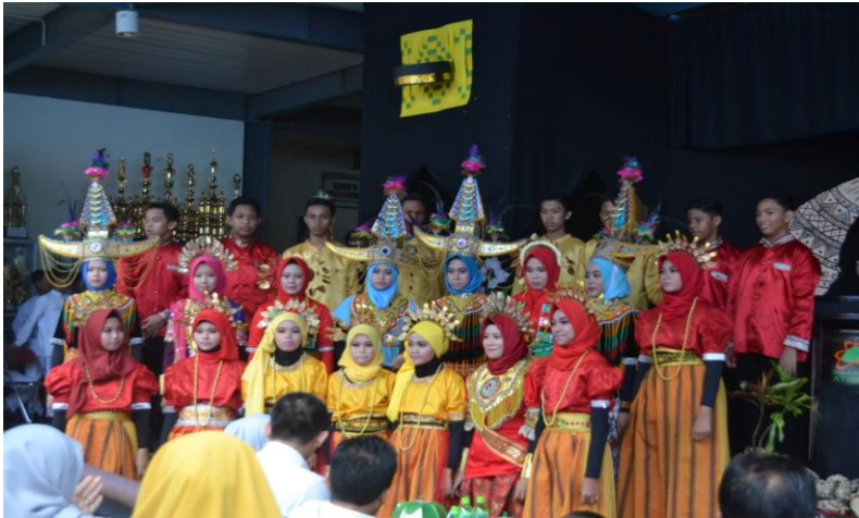
Gambar 6. Siswa-siswi SMP-SMA Islam Athirah Bone tampil dalam balutan pakaian adat daerah pada acara Hari Sumpah Pemuda

“Sekolahnya elit, bagus, berkualitas, dan mahal. Tidak mungkin masyarakat dari kalangan bawah apalagi dhuafa dapat bersekolah di Athirah”, mungkin itu kesan yang muncul tentang Sekolah Islam Athirah selama ini. Nah, mulai tahun 2011 yang lalu kalangan dhuafa berprestasi kini dapat menikmati pendidikan berkualitas di Sekolah Islam Athirah Bone melalui jalur beasiswa penuh. Bahkan dengan sekolah yang lebih baik karena berada di tempat yang nyaman, jauh dari kebisingan kota, tenang untuk belajar, pembinaan selama 24 jam oleh guru-guru muda yang penuh semangat dan berdedikasi tinggi.