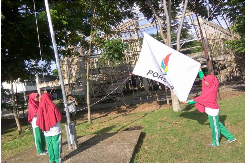
Gambar 20. Pembukaan Porseni Siswa di Sekolah Islam Athirah Bone

Oleh Muh. Reskiawan Latamara La Madukelleng