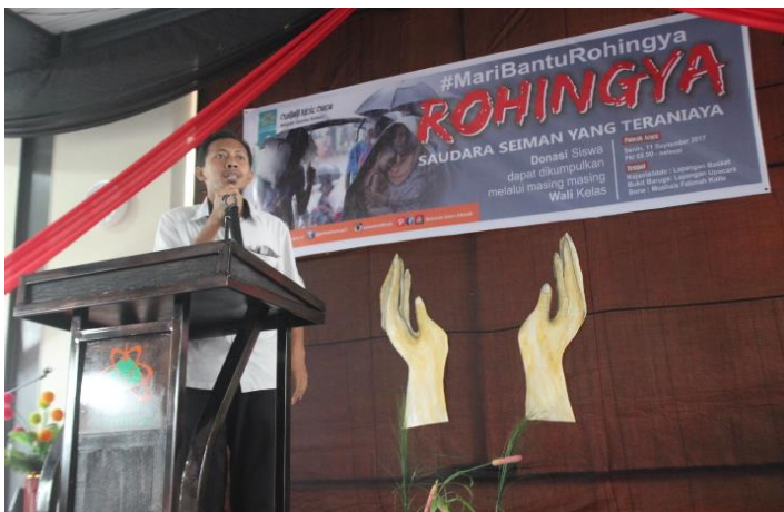
Gambar 27. Sekolah Islam Athirah Bone aktif dalam penggalangan dana kemanusiaan.

Rasulullah saw merupakan utusan Allah yang menyampaikan pesan-pesan kepada sekalian umat manusia. Nabi Muhammad saw sebagai nabi dan rasul Allah yang terakhir memiliki keistimewaan dibanding nabi-nabi sebelumnya. Salah satu keistimewaannya adalah misi risalah nabi Muhammad tidak terbatas pada umat (bangsa) tertentu, tetapi meliputi semua umat manusia ( rahmatan lila'lamin ). Semua umat manusia yang hidup pada masa Rasulullah saw hingga tibanya hari akhir nanti wajib mengikuti syariat yang dibawa Rasulullah saw.