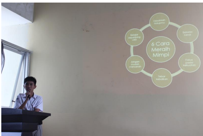
Gambar 31. Student of the Month sedang membedah buku yang menjadi hadiah pada bulan sebelumnya.

Sebagai guru, sudah seharusnya memberikan apresiasi karena di sini hal seperti itu masih menjadi barang mewah dan dengan memberikan apresiasi berupa pujian saja, anak sudah merasa senang. Perasaan senang mengantarkan mereka untuk tertib dan seterusnya akan melakukan hal baik secara berulang.