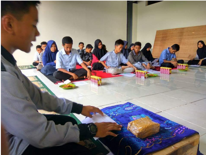
Gambar 36. Sidang Triwulan yang digelar oleh MPK

Pengertian organisasi menurut J.R.Schermehorn adalah sekumpulan orang yang bekerja sama untuk mencapai tujuan bersama. Menurut Chester J. Bernard bahwa pengertian organisasi adalah kerja sama dua orang atau lebih, suatu sistem dari aktivitas-aktivitas ( System from all activity ) atau kekuatan ( Strength ) perorangan yang dikoordinasikan secara sadar. Jadi, bisa disimpulkan bahwa organisasi merupakan sebuah perkumpulan/hubungan yang sistematis dan efektif untuk mencapai hasil yang diinginkan.