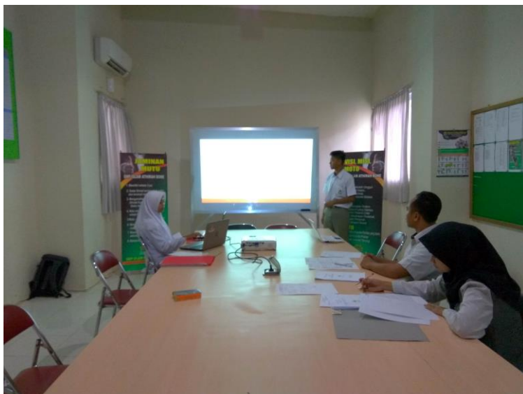
Gambar 16. Seorang siswa sedang menghadapi Sidang Artikel Ilmiah di hadapan pengujinya.

Artikel merupakan sebuah tulisan lepas yang berisikan opini atau pendapat dari seseorang dan bertujuan untuk memberitahu, mempengaruhi, dan menghibur para pembaca. Penyusunan artikel merupakan salah satu program dari SMP Islam Athirah Boarding School Bone. Sejak angkatan pertama, pimpinan sekolah sudah menginstruksikan kepada siswa kelas akhir untuk menulis dan menyusun sebuah artikel. Penyusunan artikel di sekolah ini dilaksanakan oleh siswa secara individu, bukan secara berkelompok.