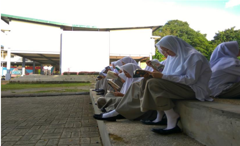
Gambar 52. Siswa-siswi sangat antusias membaca buku favoritnya pada kegiatan Reading Day .

kegiatan bulanan dan mingguan, di mana dalam kegiatan bulanan diawali dengan pembukaan oleh master of ceremony yang diperankan oleh siswa- siswi sedangkan yang mengontrol kegiatan ini ialah guru dari SMP Islam Athirah Bone, lalu seluruh siswa diarahkan untuk membaca buku selama 45 menit yaitu dimulai pada pukul 07:00 sampai dengan pukul 07:45 buku yang dibaca ialah buku yang bergenre fiksi dan bergenre non fiksi, buku pelajaran seperti Why , RPUL , karena buku tersebut memerlukan banyak waktu untuk dibaca.